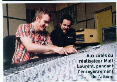
Aux côtés du réalisateur Matt Laurent, pendant l'enregistrement de l'album